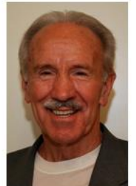
Richard Bandler et John Grinder